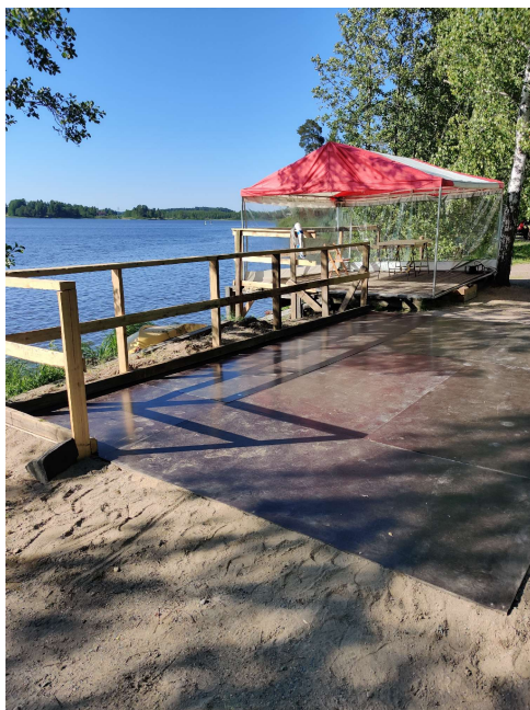
Tanssilava rakenteilla viime vuoden juhannuksena

Kuivia risuja ja oksia voi tuoda kokkorantaan tiistaina 20.6. klo 18 - 19, jos kokko on päätetty rakentaa (säävaraus) ja jos asiasta on etukäteen sovittu Erkki Torkkelin kanssa (puh. 050 392 6710).